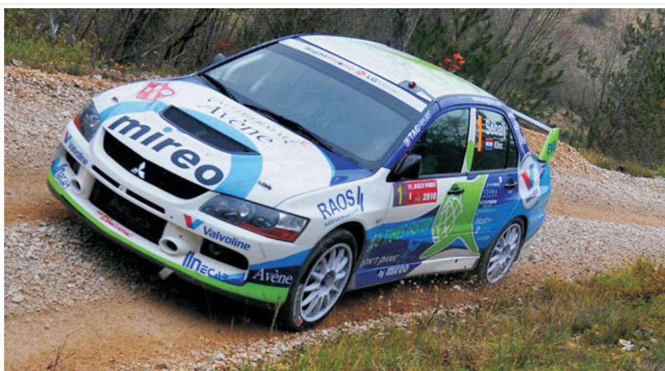
Na "prvoaprijski" rally u Kumrovcu zasad prijavljeno 28 posada

Još je nekoliko dana ostalo za prijavu vozača na prvi ovogodišnji rally. Naime, zagrebački auto klub "Delta Sport" u suradnji s Općinom Kumrovec, 1. i 2. travnja organizira međunarodno rally natjecanje pod nazivom "1. Sprint Rally Kumrovec 2011."