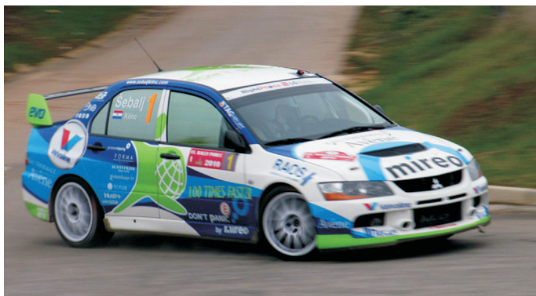
Aktuelni prvaci - posada Juraj Šebalj - Toni Kline

- Stigle su neke nove generacije, neki novi "klinci", stigao je obnovljeni, pravi "slatki i kratki" sprint rally ujedno prvo službeno bodovno natjecanje Međunarodnog i Državnog prvenstva Hrvatske u kategoriji sprint natjecanja. Tridesetak posada iz Hrvatske, Slovenije, Austrije, Mađarske, te Bosne i Hercegovine očekujemo na startu, što je za prvi nastup ove godine i specifičnost natjecanja kao i njegovo prvo izdanje, sasvim zadovoljavajuće. Sportski dio natjecanja započinje u subotu, 2. travnja od 9,31 sati, kada natjecatelji kreću iz servisnog prostora na dva brzinska ispita, koji se održavaju u neposrednoj blizini Kumrovcu. Start u večernjim satima 1. travnja, ali i cilj rallya – ceremonija i proglašenje pobjednika, očekuje se sutradan malo iza 16 sati, u centru Kumrovcu uz Muzej "Staro Selo" – kazuje prvi čovjek hrvatskog rally sporta, sportski direktor HAKS-a Slaven Dedić, ujedno i direktor natjecanja.