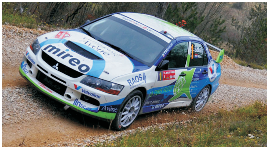
Na "prvoapriiski" rally u Kumrovcu zasad prijavljeno 28 posada

Još je nekoliko dana ostalo za prijavu vozača na prvi ovogodišnji rally. Naime, zagrebački auto klub "Delta Sport" u suradnji s Općinom Kumrovec, 1. i 2. travnja organizira međunarodno rally natjecanje pod nazivom "1. Sprint Rally Kumrovec 2011."