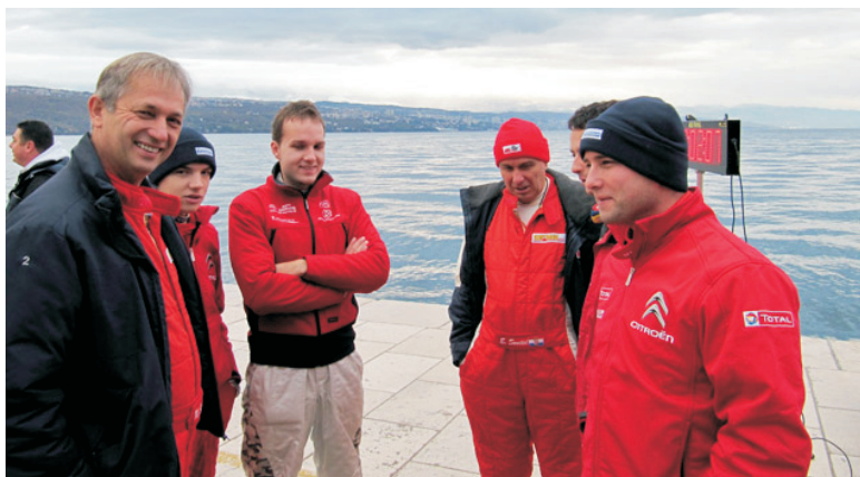
Vozачи s oduševljenjem očekuju početak sezone

RALLY: 3,2,1 - i kreće "1. sprint rally Kumrovec"! | Racing.hr