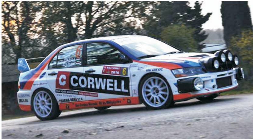
U Kumrovcu će nastupiti Madar Janos Szilagy, pobjednik prošlogodišnjeg porečkog rallya

Danas započinje hrvatska rally sezona, i to prvim izdanjem kumrovečkog sprint rallya koje će se održati u "najpoznatijem selu na svijetu" i njegovoj široj okolici. Vrijedni djelatnici auto kluba Delta Sport u suradnji s općinom Kumrovec posljednjih nekoliko mjeseci svakodnevno su radili na organizacijskim pripremama i konačno, sve je spremno za današnji, odnosno sutrašnji početak "1. sprint rallya Kumrovec 2011." - Sveobuhvatne pripreme traju od kraja prošle godine, kada smo se i odlučili da će se natjecanje održati upravo na ovim prostorima. Pomogli su nam brojni suradnici bez kojih bi ovu malu ali zahtjevnu manifestaciju teško ostvarili. Vjerujemo da ćemo se organizacijskim prvicem predstaviti u pravom svjetlu, riječi su Koralkje Tomičić, jedne od rijetkih predsjednica nekog hrvatskog autokluba koja "dirigira" uglavnom „muškom sudačkom orkestru“.